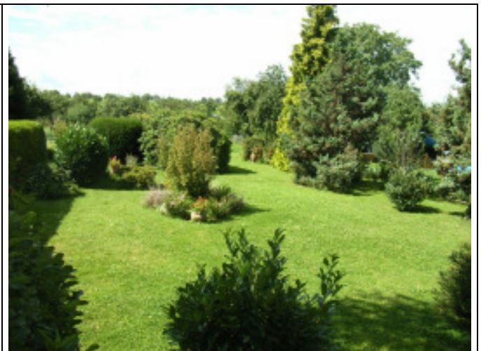
BLICK VON DER SÜDWESTTERRASSE