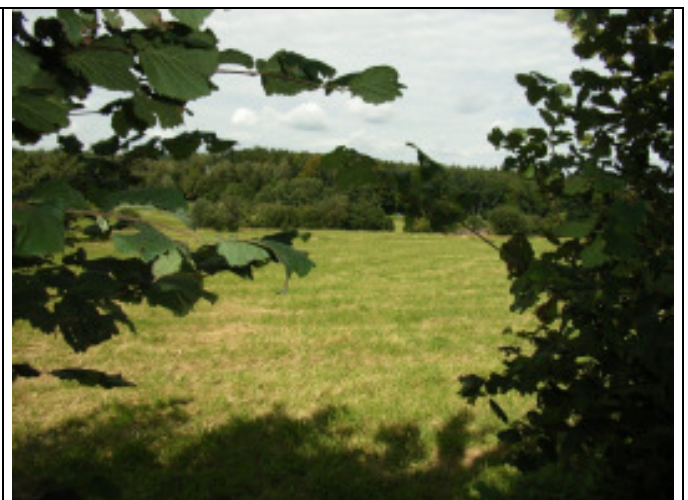
BLICK VOM GRUNDSTÜCKSENDE

Allen Angeboten und Mitteilungen liegen unsere Allgemeinen Geschäftsbedingungen zugrunde.