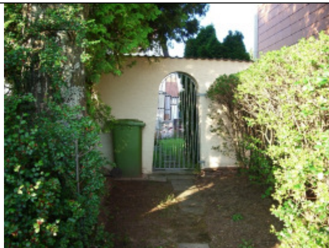
ZUGANG ZUM GARTEN